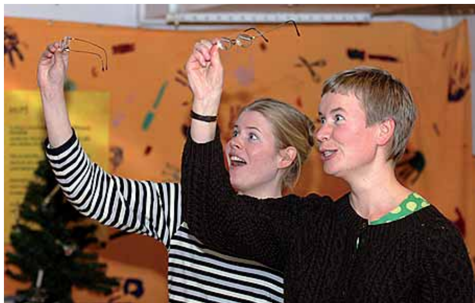
Vihreää draamaa: elämän tärkeitä asioita.