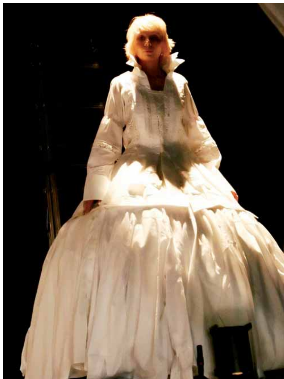
Virolaisen Von Krahl -teatterin puvustukset ja osa lavasteista ovat kierrätysmateriaalia. Kuva Von Krahl -teatterin ja Nargen Oopperan kamarioopperan "Tulentarha ja joutseneni, ajatukseni" harjoituksista.

Hitaammin, lähemmäs, vähemmän, paremmin, kauniimmin! Nykyisyys kohtelee sinua huomenna niin kuin sinä kohtelet sitä tänään. Onnen salaisuus ei ole saada enemmän vaan haluta vähemmän.