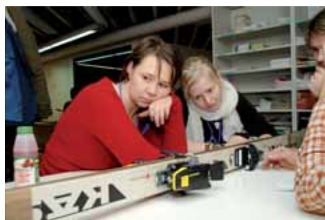
Työpajakurssilla: mitä tehdä vanhoista suksista?